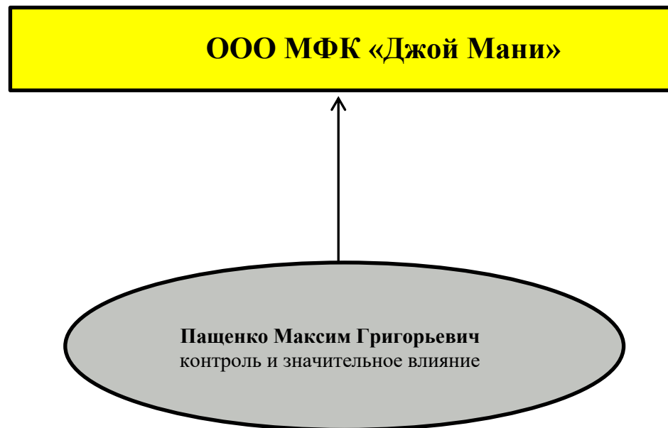
Схема взаимосвязей участников ООО МФК «Джой Мани» и лиц, под контролем либо значительным влиянием которых находится ООО МФК «Джой Мани»